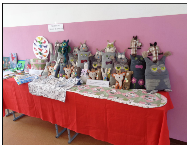
Изделия, выполненные на уроках трудового обучения и занятиях по внеурочной деятельности

Ежегодно проводится мониторинг уровня воспитанности классов, обследование психологического микроклимата. По итогам обследования за текущий учебный год в классах преобладает благоприятный психологический микроклимат.