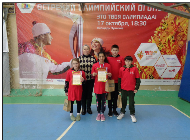
День здоровья, областная Спартакиада в г. Шуя

С целью пропаганды основных идей физической культуры, спорта и здорового образа жизни в ОГКОУ «Вичугская коррекционная школа» 1 ноября 2023 года создано общественное объединение «Школьный спортивный клуб «Чемпион». ШСК имеет свою символику, название, эмблему, единую спортивную форму. Девиз ШСК: «Ни шагу назад, ни шагу на месте, только вперед и только все вместе». Деятельность ШСК имеет важное общественно-социальное значение для формирования устойчивой мотивационной здоровой позиции обучающихся в отношении физической культуры и спорта, предотвращения возможности вовлечения их в антисоциальную деятельность. ШСК призван средствами физической культуры и спорта всемерно способствовать сохранению здоровья детей и подростков, повышению их работоспособности, готовности к защите Родины, формированию у них высоких нравственных качеств, организации досуга.